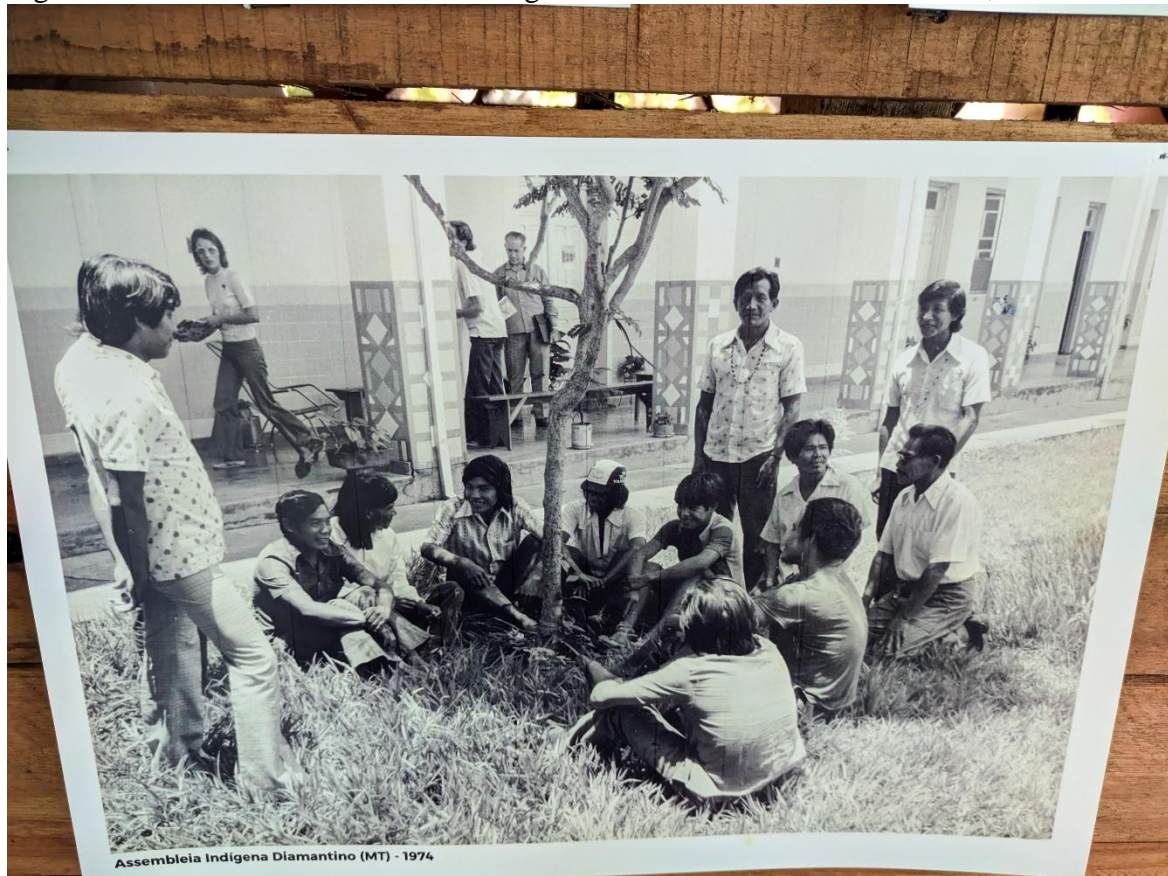
Figura 2- 1ª Assembleia dos Chefes Indígenas em Diamantino/ Mato Grosso, 1974.

originários, promovendo a participação ativa em espaços políticos e contribuindo para a inclusão de seus direitos na Constituição Federal de 1988. Assim, a mobilização iniciada na década de 1970 consolidou-se como um movimento contínuo de resistência, reafirmação identitária e luta por justiça social e territorial.