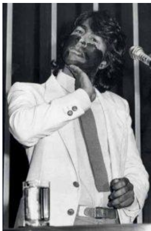
Figura 3- Ailton Krenak na constituinte, 1988.