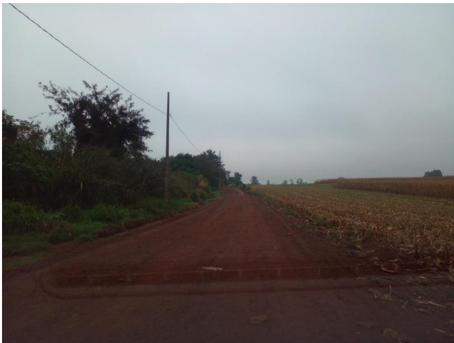
julho de 2023.

Nas atividades do projeto foram reunidos diversos relatos dos indígenas indicando sintomas por intoxicação aguda ou crônica e contaminação do solo e das águas por agrotóxicos. Foram expostos impactos à saúde mental, física e espiritual em crianças, jovens, adolescentes e idosos relacionados à contaminação pelo uso de agrotóxicos nas áreas próximas as comunidades. Tais relatos fundam suspeitas de contaminação pelos produtos tóxicos utilizados por produtores rurais e que derivam para as aldeias, escolas e roças contaminando o ambiente e os organismos, dentre eles, o humano. Acrescenta-se que essa situação, embora acentuada atualmente, não é recente. Em 2004, a Funai já realizou estudo sobre a utilização de agrotóxicos no entorno da Reserva Indígena Avá-Guarani de Oco’y em São Miguel do Iguaçu (FUNAI, 2004), indicando os efeitos da utilização destes produtos tóxicos às comunidades expostas.