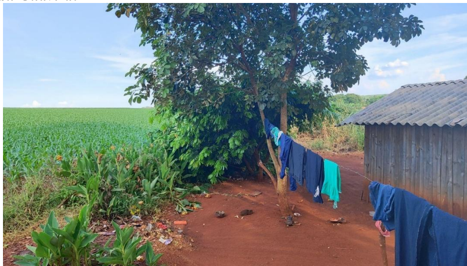
março de 2023.

No caso da Reserva Indígena de Oco'y a situação não é diferente, pois está cercada por lavouras monocultoras, sendo, quando muito, separada somente pela estrada que circunda a reserva (Figura 3).