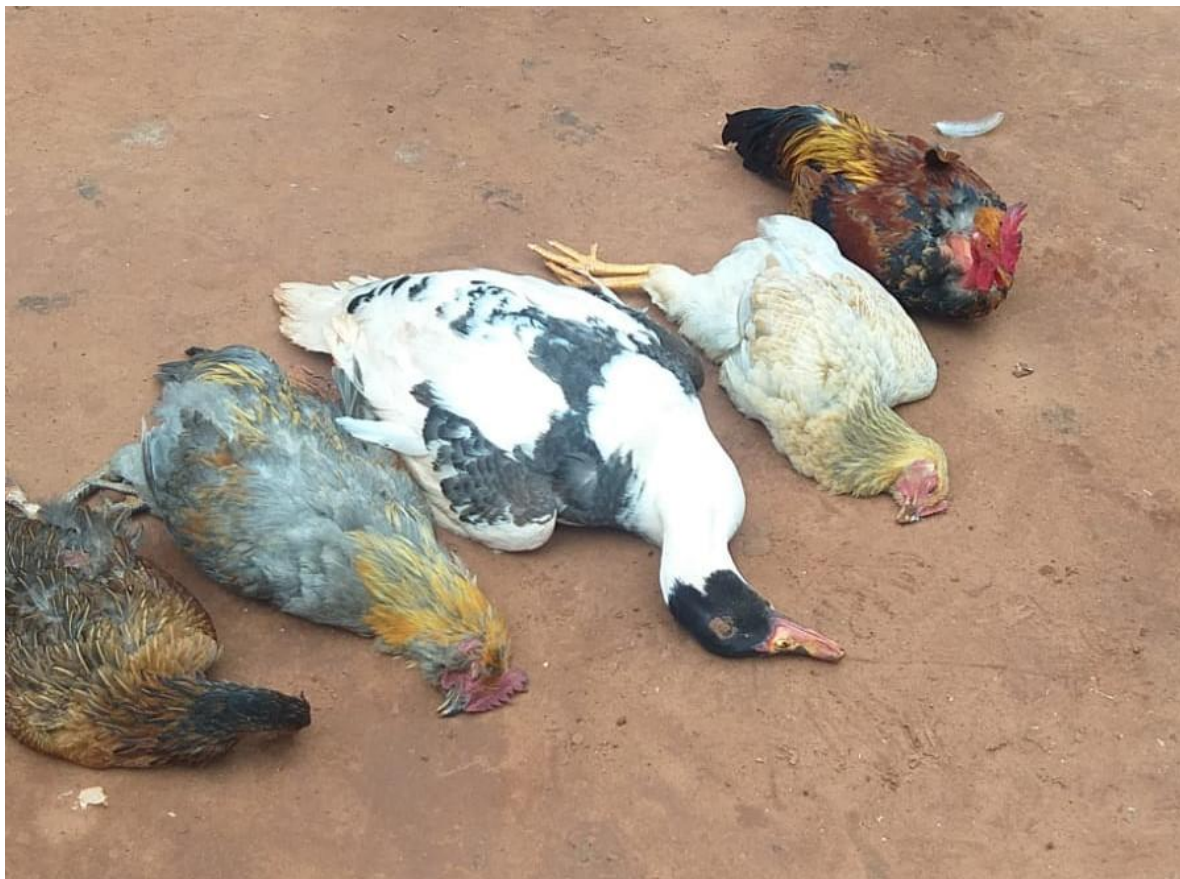
Figura 4: Aves criadas pelos Avá-Guarani mortas e debilitadas em decorrência do contato com agrotóxicos.