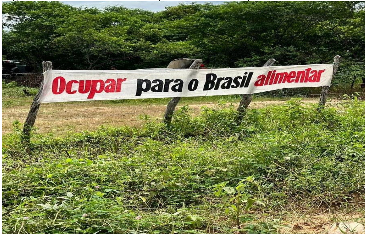
Figura 2 – Sertões de Crateús – município de Crateús – Acampamento Curralinhos do MST

Momento de campo no enceramento da manifestação em alusão ao dia do trabalhador.