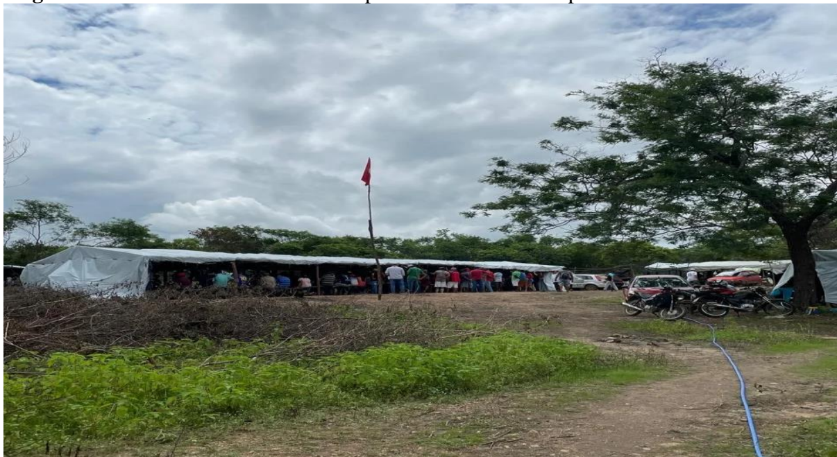
Figura 1 – Sertões de Crateús – município de Crateús – Acampamento Curralinhos do MST

Momento de campo no enceramento da manifestação em alusão ao dia do trabalhador.