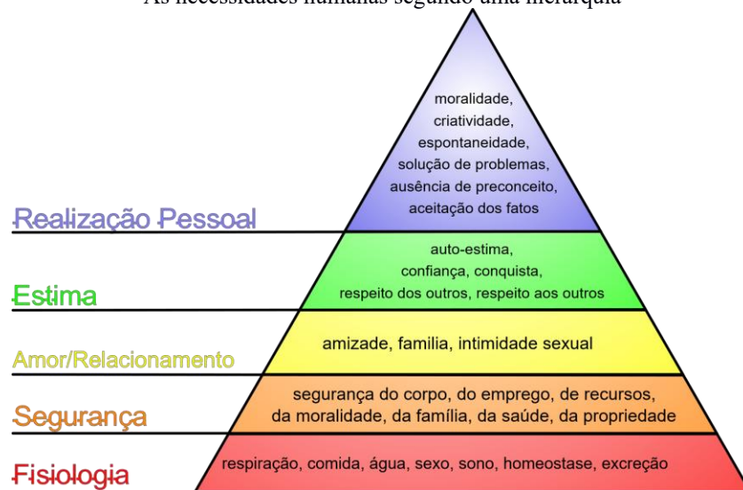
Pirâmide de Maslow: Wikipédia (2025)

As necessidades humanas segundo uma hierarquia