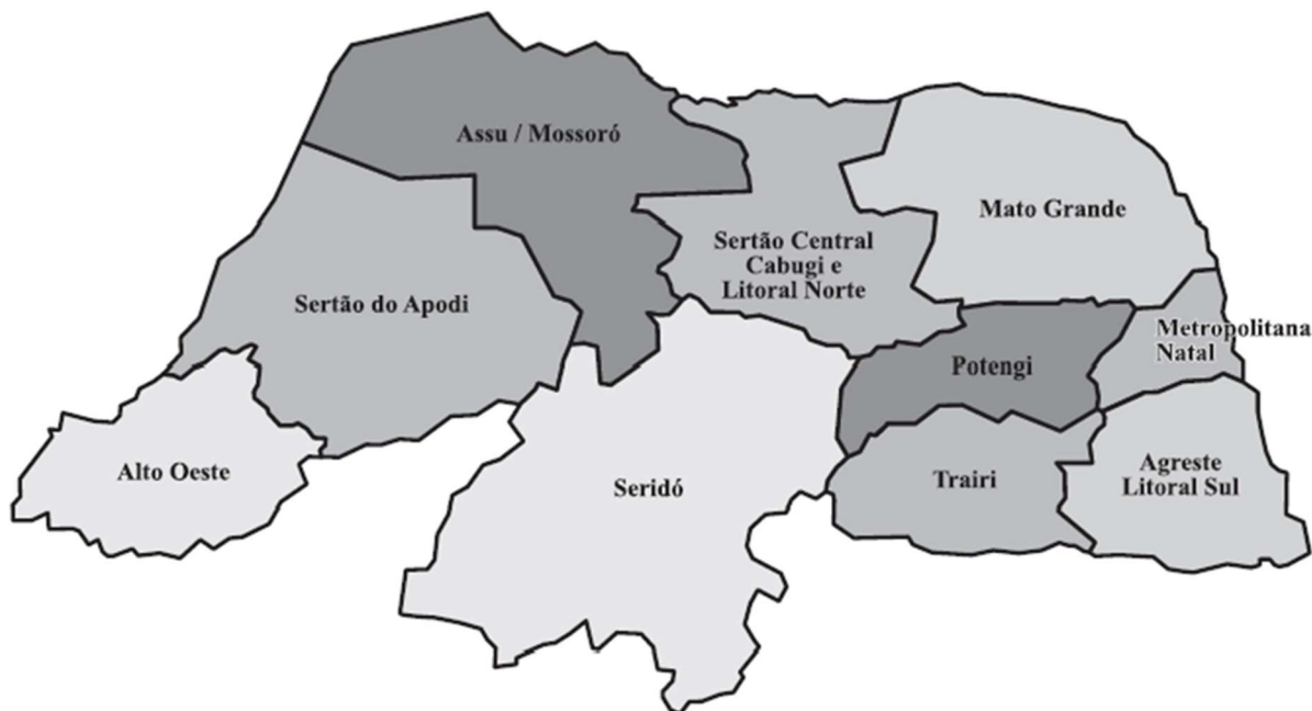
Figura 1: Mapa do estado do Rio Grande do Norte (RN) com os Territórios Rurais e da Cidadania

Para realizar este trabalho, a abordagem de pesquisa mais específica adotada será o estudo de caso, no qual se investigou a evolução e os limites do Microcrédito Rural, na sua forma AGROAMIGO, nos Territórios da Cidadania Alto Oeste Potiguar e Sertão do Apodi. Foi utilizada uma pesquisa com um questionário semi estruturado, que continha perguntas abertas e fechadas, aplicado aos agentes de desenvolvimento que gerenciam o programa nas agências bancárias dos municípios pertencentes aos Territórios. Além disso, foram coletados dados de um Banco de Dados abrangente e detalhado do Banco do Nordeste, que organiza informações sobre as operações do AGROAMIGO no período de 2005 a 2021 na área em questão.