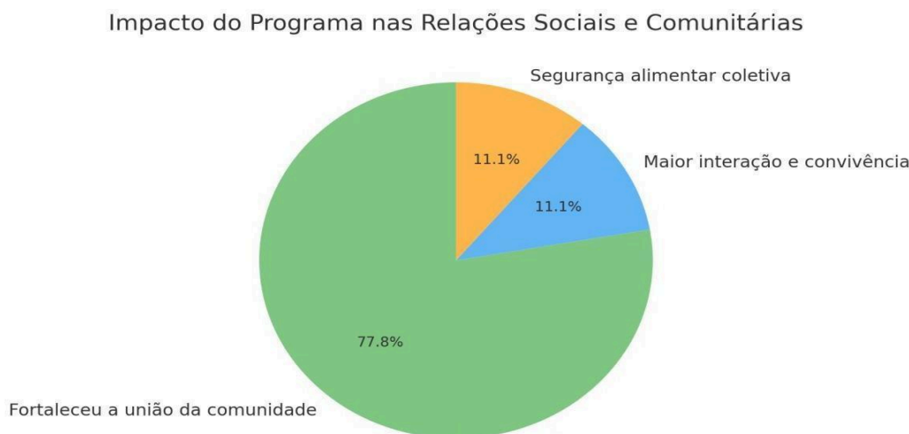
Gráfico 02: Impacto do Programa nas Relações Sociais e Comunitárias

No entanto, as discussões também abordaram os desafios que ainda precisam ser enfrentados para garantir a efetividade do PAA nas comunidades quilombolas. Entre os principais obstáculos apontados, destaca-se a necessidade de maior capacitação dos produtores locais para que possam atender às exigências do programa de forma mais eficiente. A adaptação das práticas agrícolas e a obtenção de tecnologias adequadas são aspectos que ainda demandam atenção. Como ressaltam Lima e Souza (2022, p.106), "um dos principais desafios para o sucesso do PAA é a capacitação contínua dos produtores para garantir que eles possam atender aos requisitos técnicos e de qualidade exigidos pelo programa".