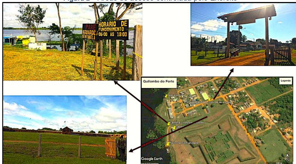
Figura 2 – Áreas de acesso controlada pelo Exército

Um episódio marcante ocorreu quando técnicos do INCRA, em vistoria para elaborar do RTID, foram impedidos de cessar determinadas áreas, como as de castanhais. Em outra ocasião, sob o comando militar distinto, a comunidade foi impedida de utilizar o porto, espaço multifuncional destinado ao atracamento de canoas, lazer e ponto de partida da procissão do Divino (Figura 2)