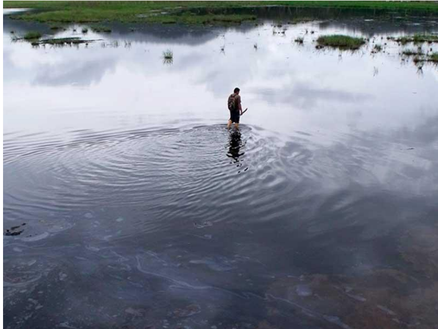
Figura 3 – Lago de Guanoco.