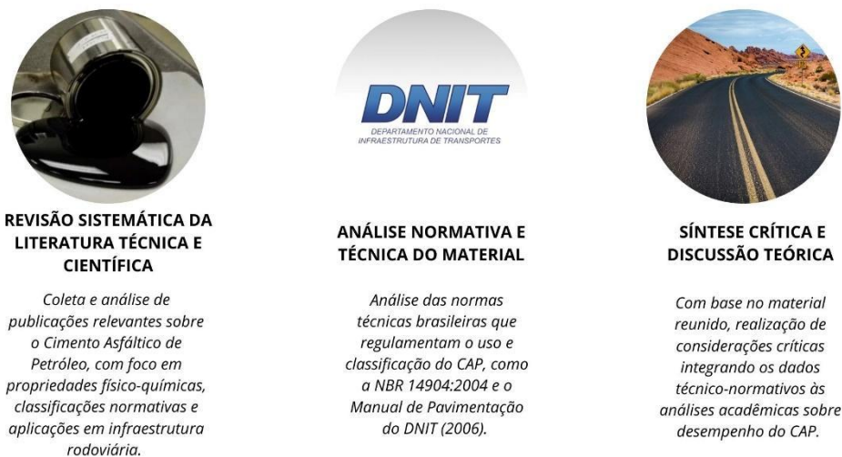
Figura 1 - Etapas da pesquisa.

A revisão bibliográfica também permitiu identificar lacunas existentes na literatura nacional, especialmente no que se refere à caracterização do desempenho do CAP em diferentes contextos climáticos e à incorporação de aditivos modificadores, temas que vêm ganhando destaque na engenharia de pavimentos.