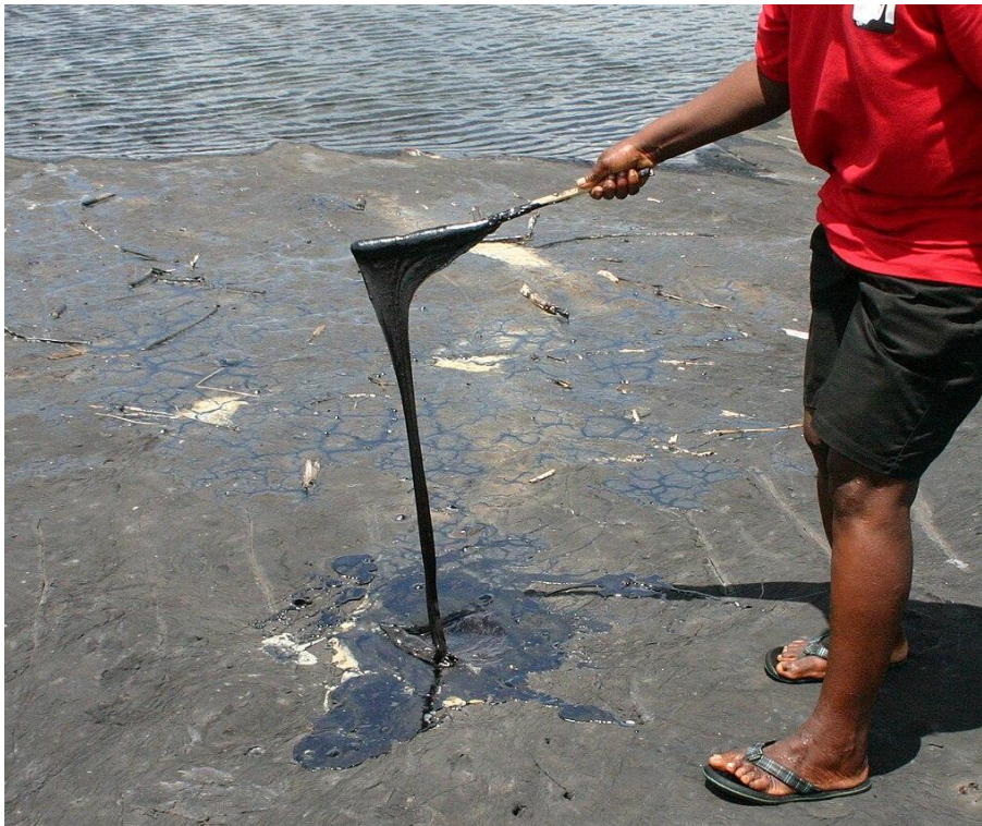
Figura 2 – Lago de La Brea.