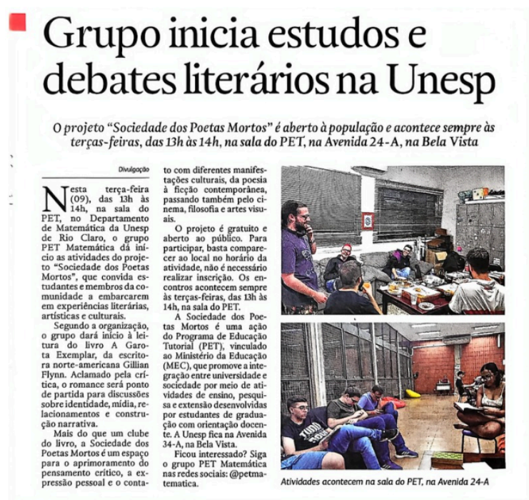
Figura II