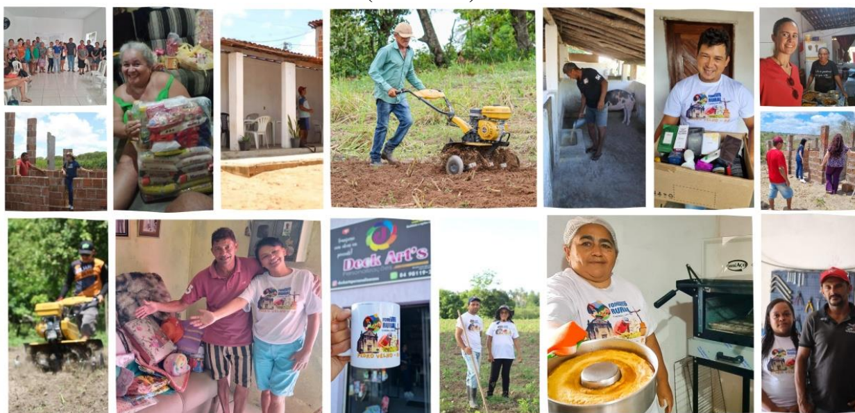
Ilustração 1: Atividades desenvolvidas e financiadas pelo Programa Fomento Rural (2024-2025).