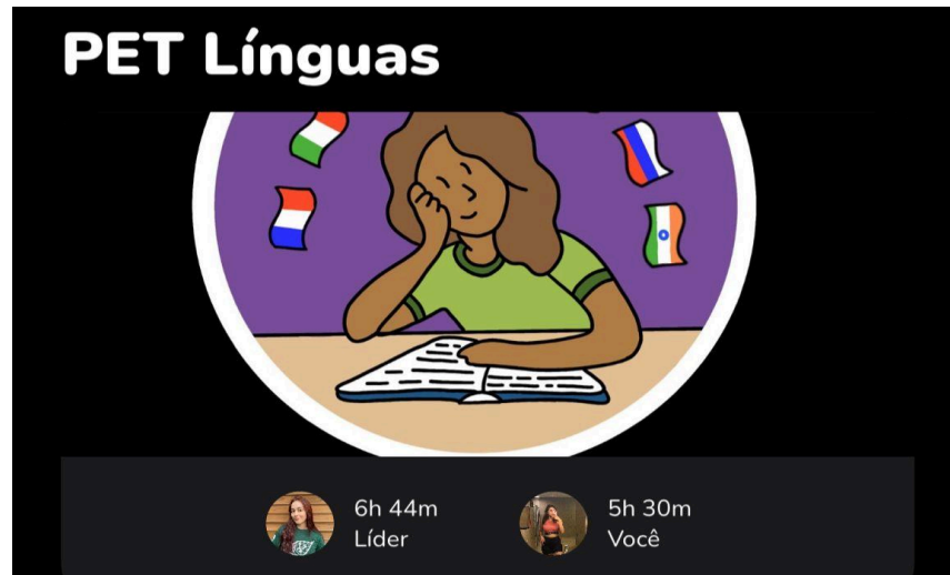
Figura 2 — Utilização do Gymrats