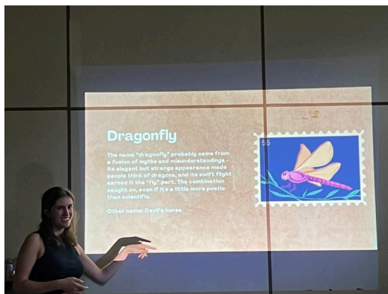
Figura 1 — Primeira Edição do PET Línguas Estrangeiras

abordando a arquitetura e a história da moda na França. A terceira e última edição até o momento teve como tema o Espanhol, em que foram realizadas apresentações sobre as diferenças de significado da mesma palavra em diferentes países hispânicos. Todas as edições alcançaram o objetivo de conectar os petianos com a cultura e idiomas estrangeiros de maneira descontraída.