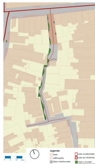
Figura 05 - Proposta com reassentamento