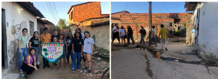
Figura 02 - Entrevista e visita técnica à comunidade

O ArqPET atuou em parceria com o Quintau Coletivo na organização de entrevistas com os moradores, oficinas participativas e visitas técnicas em campo (figura 02) para realizar levantamentos e mapeamento das casas. No que se refere às entrevistas, foram realizados alguns encontros entre os moradores e a equipe técnica do projeto, com o objetivo de entender quais problemas a comunidade lida no cotidiano. Já na etapa de confecção e realização das oficinas, eram realizados momentos que buscassem de forma cartográfica, caracterizar quais espaços eram utilizados para lazer, quais possuíam uma função voltada para a mobilidade e quais regiões eram mais impactadas pelos alagamentos.