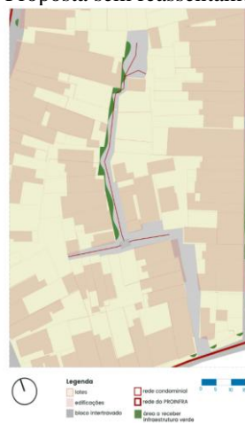
Figura 03 - Proposta sem reassentamento