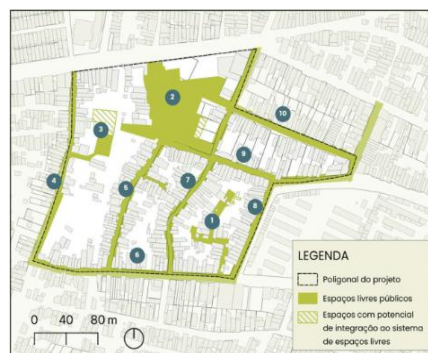
Figura 04 - Áreas verdes reservadas ao projeto. 1 - Travessas Franciscano; 2 - Área Verde; 3 - Miolo de quadra verde; 4 - R.Nubia Araujo; 5 - R.aguapé verde; 6 - R.Franciscano; 7- R.verdes mares; 8 - Rua D; 9 - R.nova Friburgo; 10 - TV. Nova Friburgo