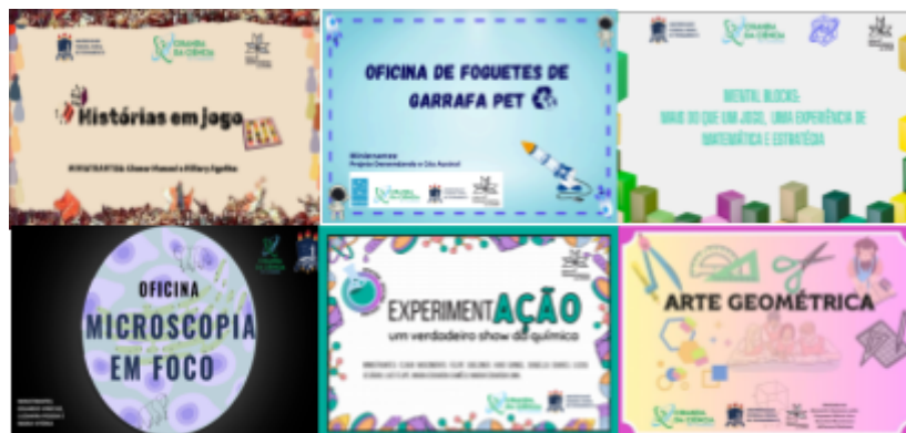
Figura 2 – Cartazes de Divulgação das Oficinas ofertadas