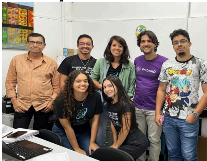
Figura 1 – Primeira Reunião

As ações ocorreram conforme o cronograma estabelecido e, ao término, aplicou-se um questionário avaliativo para coletar as percepções dos estudantes sobre a experiência.