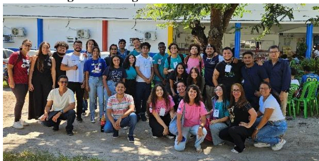
Figura 4 – Registro Final da Atividade

Durante a execução, imprevistos ocorreram: as inscrições não haviam sido concluídas previamente e precisaram ser organizadas minutos antes do início das atividades. Além disso, faltaram listas e salas previamente reservadas. Apesar disso, a equipe demonstrou flexibilidade e organização, garantindo o bom andamento do evento. O entusiasmo dos alunos e a participação ativa compensaram os contratemplos, resultando em uma experiência exitosa.