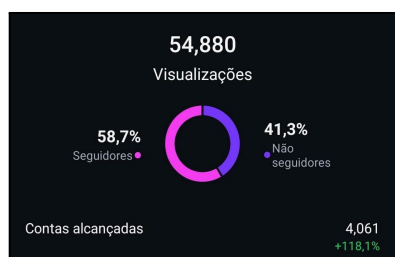
Figura 2 – Visualizações

O perfil, nesse período analisado, fez ao todo, 33 compartilhamentos, sendo respectivamente 28 stories e 5 publicações e ao todo, entretanto, o tipo de publicação que mais alcança seguidores, são as postagens, que acumulam 66,1% das nossas visualizações totais (cerca de 36 mil visualizações). Ao todo foram registradas 54.880 visualizações, sendo que dessas visualizações, 41,3% foram de usuários que não seguem o perfil e 58,7% foram de usuários que seguem o perfil. Também houve um total de 4.061 contas novas alcançadas, ou seja, usuários que nunca haviam interagido anteriormente com o conteúdo do perfil, representando 7,4% das visualizações.