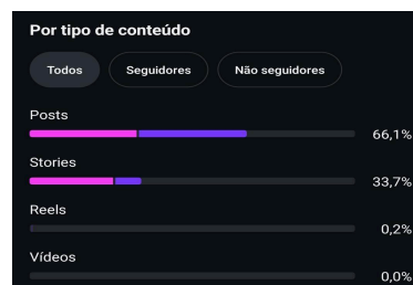
Figura 3 – Tipo de conteúdo