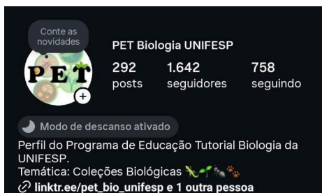
Figura 1 – Página inicial da conta

Fonte: Instagram , autoria própria (2025).