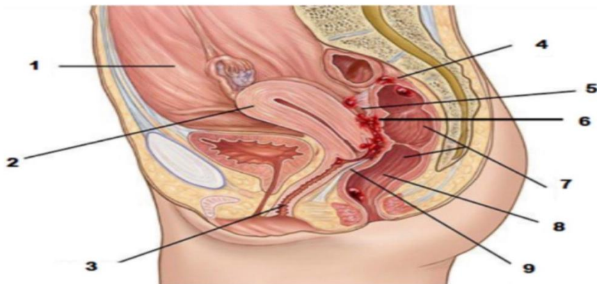
Figura 1 – Representação da endometriose na pelve. 1. Peritônio; 2. útero; 3. vagina; 4. cólon sigmoide; 5. lesão de endometriose; 6. fundo de posterior; 7. retossigmoide; 8. reto; 9. septoretovaginal.

Dessa forma, é uma doença ginecológica dependente de estrogênio, em que tecido semelhante ao endométrio cresce fora do útero. Afeta principalmente pelve, ovários, trompas e peritônio conforme demonstrado pelas lesões vermelhas na Figura 1, mas também pode atingir locais menos comuns, como diafragma e sistema nervoso (Levine., 2022).