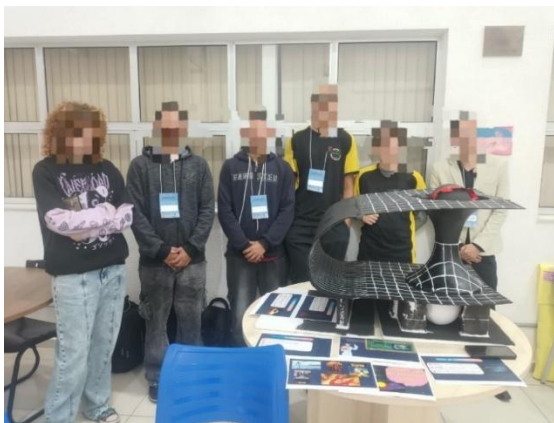
Figura 2 – Estudantes e orientador apresentando a maquete didática da Ponte de Einstein–Rosen na Mostra de Materiais Didáticos do V SIMPEDUC 2025, Unifei.

A Figura 2 apresenta os estudantes autores do projeto acompanhados pelo orientador, durante a exposição da maquete didática da Ponte de Einstein–Rosen na Mostra de Materiais Didáticos do V SIMPEDUC 2025, realizado na Unifei). Essa mostra compôs uma das sessões do evento, que também incluiu oficinas, palestras e apresentações de trabalhos científicos. A participação dos alunos nesse espaço promoveu a socialização de experiências pedagógicas inovadoras e o compartilhamento de práticas voltadas ao ensino de Física Moderna, evidenciando o potencial formativo e interdisciplinar da proposta.