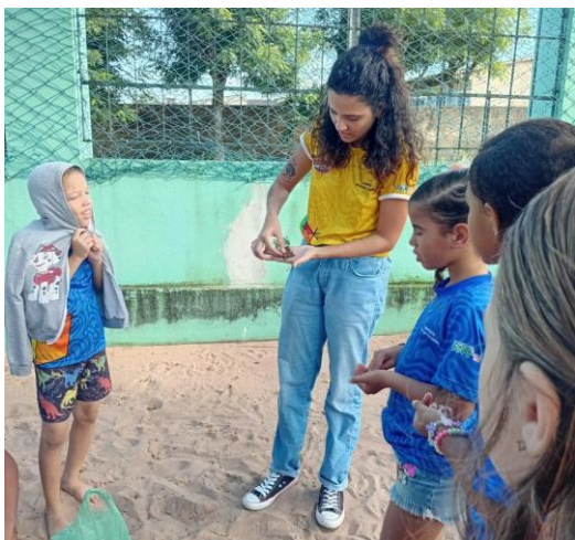
Imagem 1: Aula prática sobre biosfera

visualização e o entendimento das dinâmicas terrestres de forma mais efetiva. Paralelamente, a criação de uma horta comunitária escolar aproximou os alunos do contato direto com o solo e os elementos da natureza, ampliando sua compreensão sobre temas como o ciclo da água, as camadas da Terra e a relação entre vegetação e conservação ambiental.