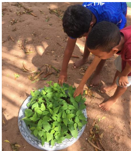
Imagem 2: Aula prática sobre vegetação e solos