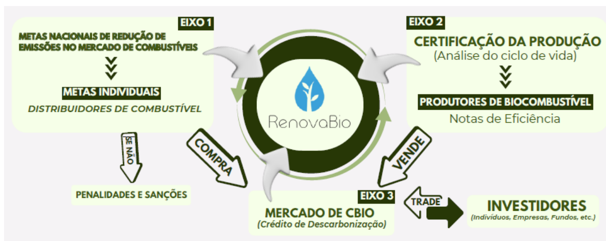
Figura 1: Funcionamento do RenovaBio

mercado organizado e adquiridos pelos distribuidores de combustíveis, responsáveis pelo cumprimento das metas de descarbonização (MME, 2022).