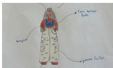
Fig.1 - Desenho colorido da adodescente C

Por outro lado, observa-se que oito adolescentes demonstraram ter construído uma identidade racial, tanto por fazerem menção explícita à cor da pele, quanto por colorirem o desenho com lápis de cor, como se vê na figura 1, a seguir: