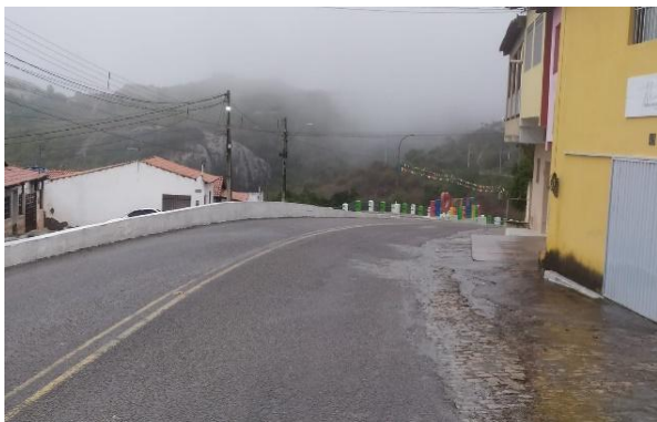
Figura 1: Vista parcial da área urbana de Monte da Gameleiras (RN)

O ambiente térmico associado com as altitudes desses lugares, quando comparado com a média térmica do semiárido, transformou-se, também, em um atrativo a mais para os visitantes e estímulo para imersão aos vários pontos da região, principalmente, em grande parte de áreas de Serra de São Bento e Monte das Gameleiras.