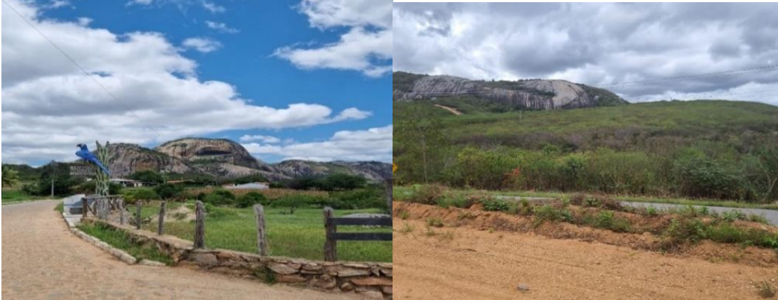
Figura 03 - Parque Estadual Pedra da Boca e vista parcial dos municípios de Serra de São Bento (RN) e Passa e Fica (RN)

Fonte: pesquisa primária dos autores. Setembro de 2023.