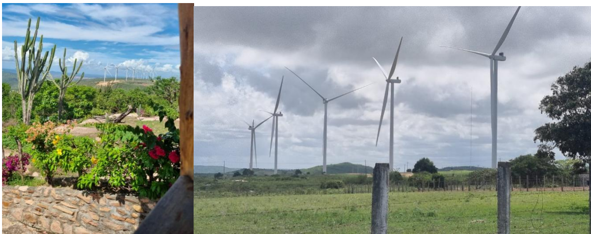
Figura 2: imagem parcial do Parque Eólico Umari na área de estudo