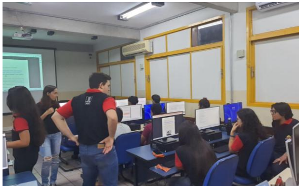
Figura 1 – Minicurso ministrado em 2023