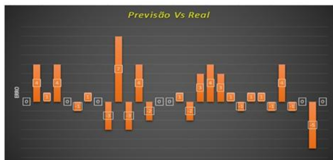
Figura 7: Gráfico de Previsão Vs Real com o cálculo de erro