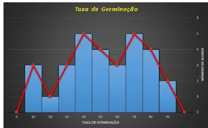
Figura 6: Tabela e Gráfico da Taxa de Germinação

Finalizando essa parte de construção e análise dos resultados, foi construído um gráfico da previsão que no caso foram os palpites que eles deram no início da atividade versus a quantidade real de sementes germinadas (Figura 7) cumprindo assim todos os objetivos proposto pela SE.