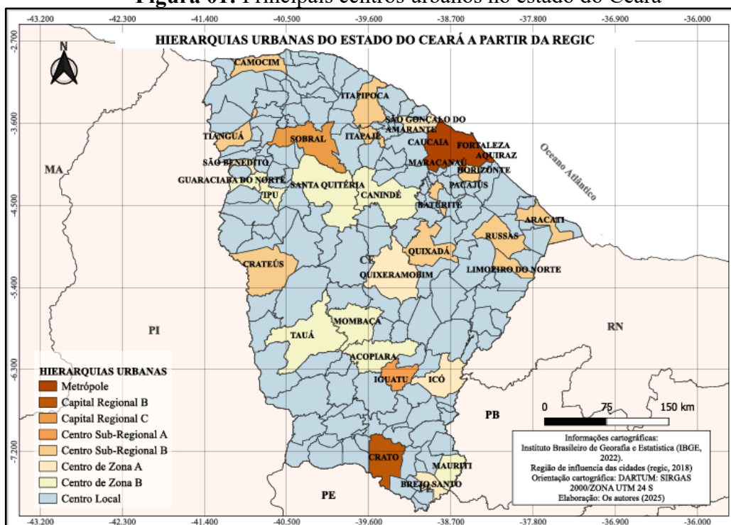
Figura 01: Principais centros urbanos no estado do Ceará