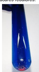
Figura 3: Teste para açúcares redutores.