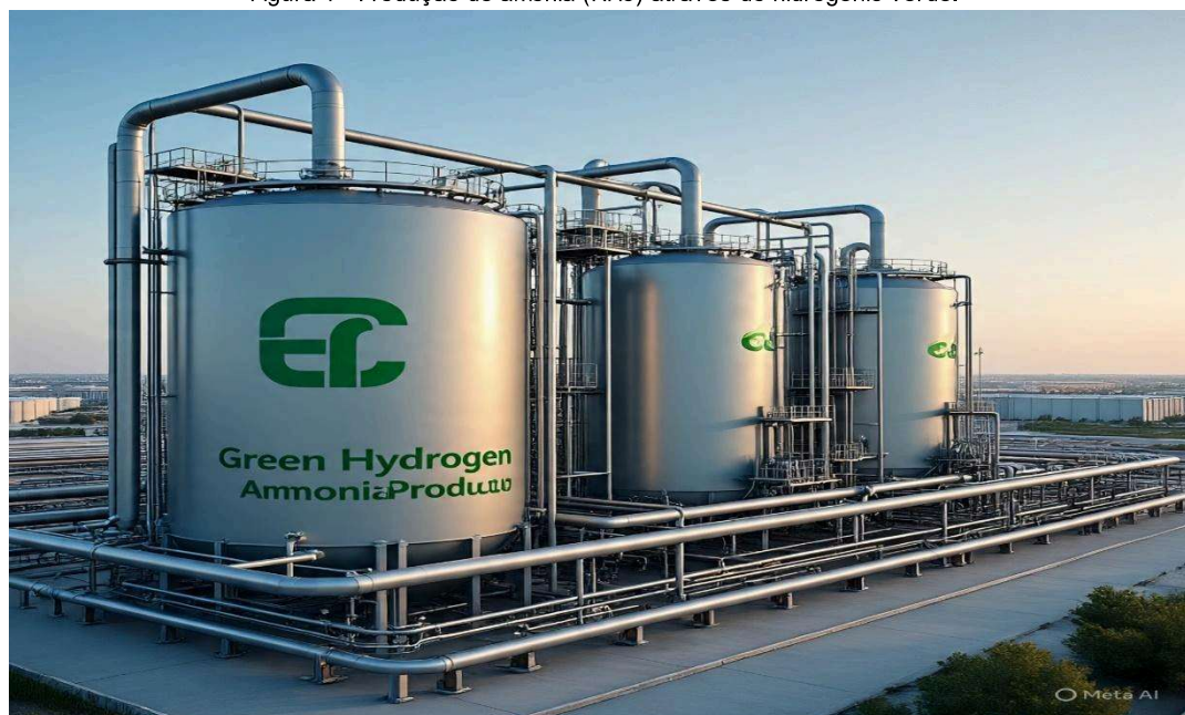
Figura 1 - Produção de amônia ( \text{NH}_3 ) através do hidrogênio verde.

Os resultados esperados indicam que a integração do hidrogênio verde à produção de amônia pode representar uma solução economicamente viável e ambientalmente vantajosa reduzindo a dependência externa de fertilizantes de forma a contribuir para a descarbonização da cadeia produtiva. Espera-se ainda que o uso dessa tecnologia impulse o desenvolvimento da economia popular associada ao agronegócio, ampliando oportunidades de trabalho e renda e fortalecendo a competitividade nacional no mercado global de fertilizantes. A Figura 1 ilustra o processo de utilização de hidrogênio verde na fabricação da amônia.