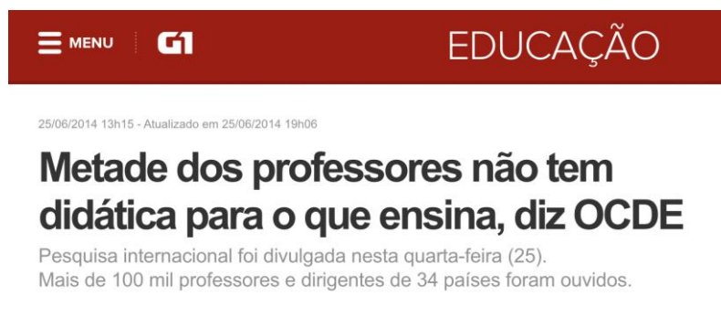
Figura 3 - Manchete G1 Educação