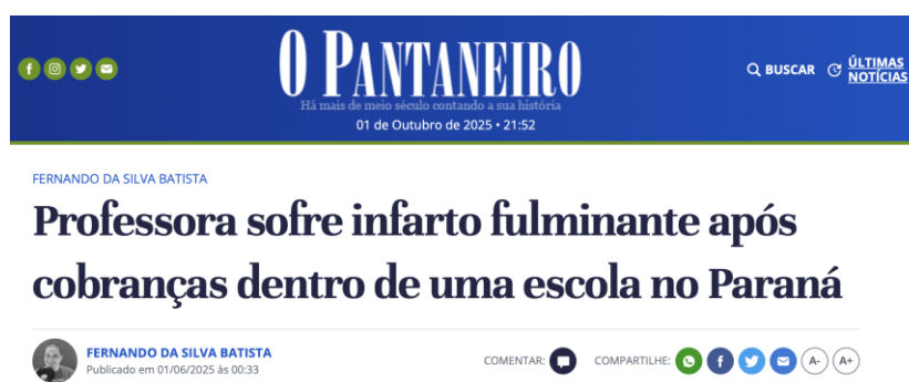
Figura 2 - Manchete O Pantaneiro