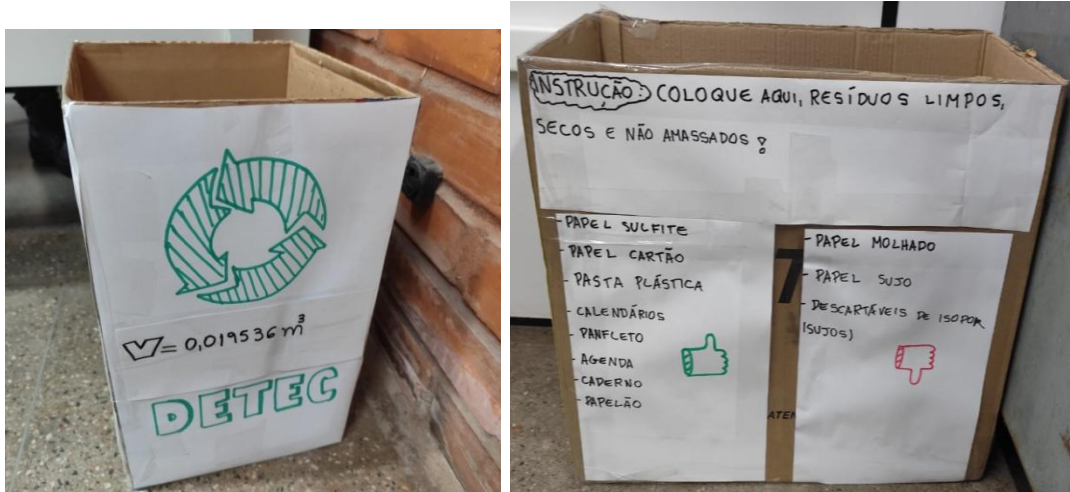
Figura 2. Coletores feitos de caixas de papelão para segregação de papel nos setores

Diante disso, confeccionaram-se coletores para a coleta seletiva do papel, utilizando caixas de papelão reaproveitadas. Cada caixa teve seu volume calculado a partir das medidas de altura, largura e comprimento, e, posteriormente, foi padronizada com o símbolo da reciclagem, a identificação do setor, o volume da caixa e instruções simples sobre como descartar corretamente o papel, e entregues nos respectivos setores, conforme a Figura 2, os quais foram distribuídos nos setores que foram investigados