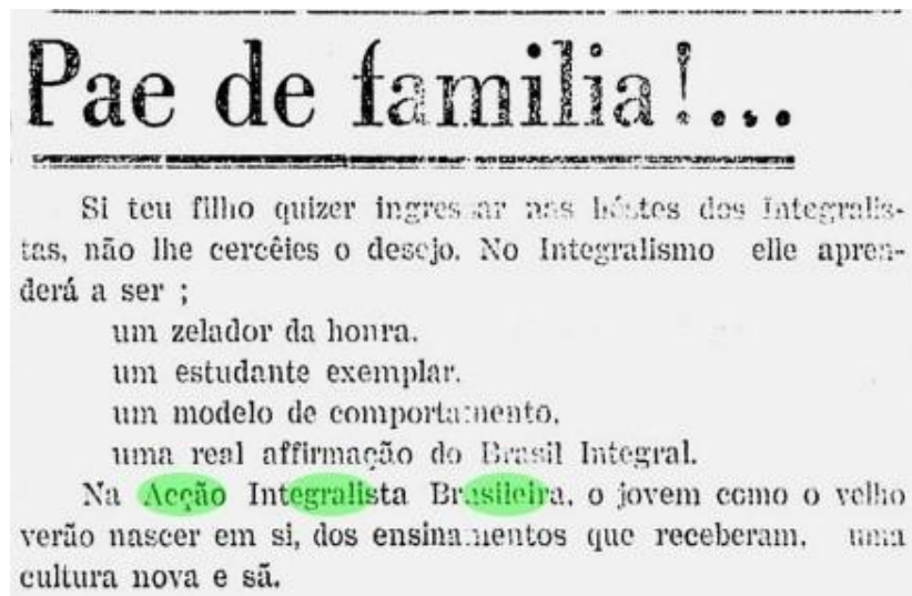
Figura 2: excerto retirado de “Pacotilha, 03/1935, p.6”.

O jornal Pacotilha, ao publicar a propaganda que apelava diretamente ao "Pae de familia!" para alistar seus filhos no movimento, estava engajado em uma luta discursiva para impor o Integralismo como o modelo ideal de cidadania. O recurso ilustrativo dessa propaganda mostra o esforço em doutrinar a juventude nos valores de "Deus, Pátria e Família".