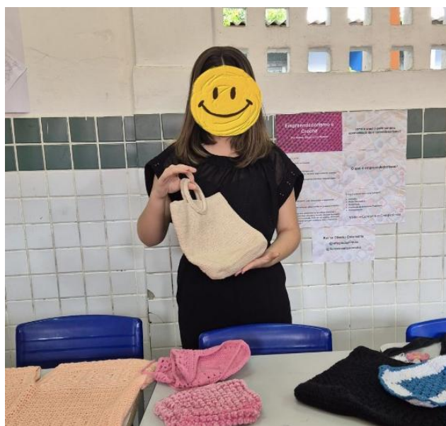
Figura 4: Culminância da Eletiva

Na penúltima semana os estudantes se organizaram para culminância da eletiva, fizeram produção de cartazes e escolheram algumas peças que iriam ser expostas. Na vigésima semana foi realizada a culminância da eletiva na escola, com a participação da comunidade escolar e das famílias. Os estudantes puderam expor as peças produzidas por eles (Figura 4):