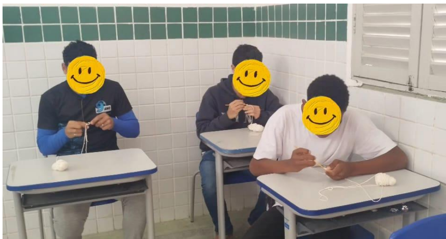
Figura 2: Estudantes na Eletiva de Crochê

e o fio de forma correta e como fazer o nó inicial. Na terceira semana foi ensinado como fazer os primeiros pontos de crochê ( correntinhas e ponto baixo ), para desenvolver habilidades básicas na execução de peças simples como pode-se observar na Figura 2: