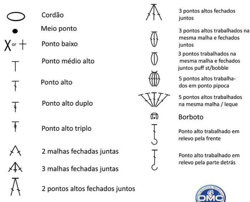
Figura 1: Símbolos Universais do Crochê

própria, a Matemática com toda a sua simbologia e o crochê com as suas representações gráficas por meio dos símbolos universais (Figura 1).