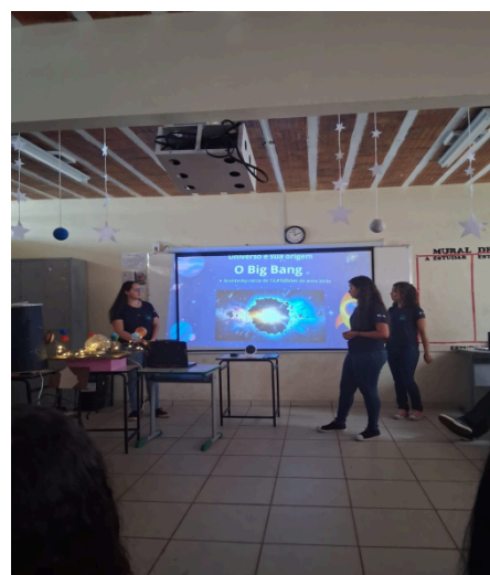
Figura 2: Exposição Teórica