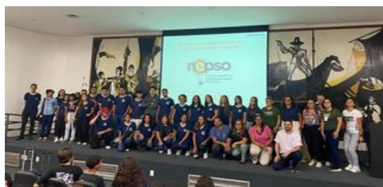
Figura 4 – Registros de apresentações dos resultados da pesquisa na comunidade escolar e na UFMG