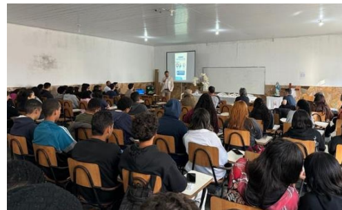
Figura 1 – Registros dos processos de escolha e qualificação do tema pesquisado

Durante o trabalho de campo, os estudantes aplicaram o questionário elaborado coletivamente junto à comunidade escolar, vivenciando na prática todas as etapas de uma pesquisa de opinião. Essa experiência possibilitou o contato direto com os respondentes, o exercício da responsabilidade ética na coleta de dados e a valorização do protagonismo juvenil no processo investigativo.