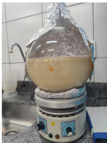
Figura 2: Balão e chapa elétrica

As amostras foram fragmentadas em liquidificador e transferidas para o aparelho extrator de Clevenger, na proporção 1:10 (m/v), correspondente a 300 g de gengibre para 3 L de água destilada, compatível com a capacidade do balão de destilação. A hidrodestilação foi realizada com aquecimento em chapa elétrica como mostra a imagem (Figura 2), conduzindo os vapores ao condensador, onde ocorreu a formação de mistura de hidrolato e óleo essencial. A separação das fases deu-se por diferença de densidade como mostra a imagem (Figura 3) (Clevenger, 1928; Silva et al., 2020). O procedimento foi repetido quatro vezes por semana, totalizando aproximadamente 6 kg de gengibre fresco processados.