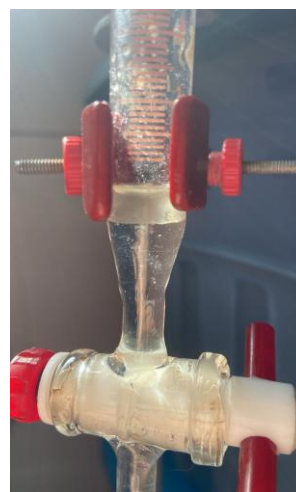
Figura 3: Separação de fases.