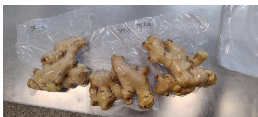
Figura 1: Gengibre higienizado e embalado por porções

Os rizomas de gengibre ( Zingiber officinale ) foram adquiridos em comércio local de São Luís – MA e transportados ao Laboratório de Carnes do IFMA, campus Maracanã. No laboratório, os rizomas foram higienizados mediante lavagem com detergente neutro e imersão em solução de hipoclorito de sódio (20 mL de água sanitária para 1 L de água filtrada). Após a secagem, os rizomas foram pesados em porções de 300 g, conforme registro fotográfico da pesquisa na figura 1.