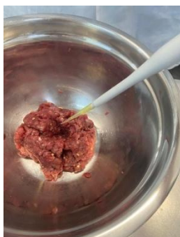
Figura 4: Aplicação do óleo.

Hambúrgueres bovinos foram preparados com coxão mole, removendo-se as gorduras aparentes. A carne foi moída e misturada com sal, alho e óleo essencial a 0,01% (m/m). O óleo foi incorporado diretamente à mistura cárnea, permitindo posterior análise de efeito antimicrobiano e caracterização físico-química dos produtos como mostra a imagem 4 e 5 (Figura).