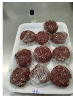
Figura 5: Amostras com óleo essencial