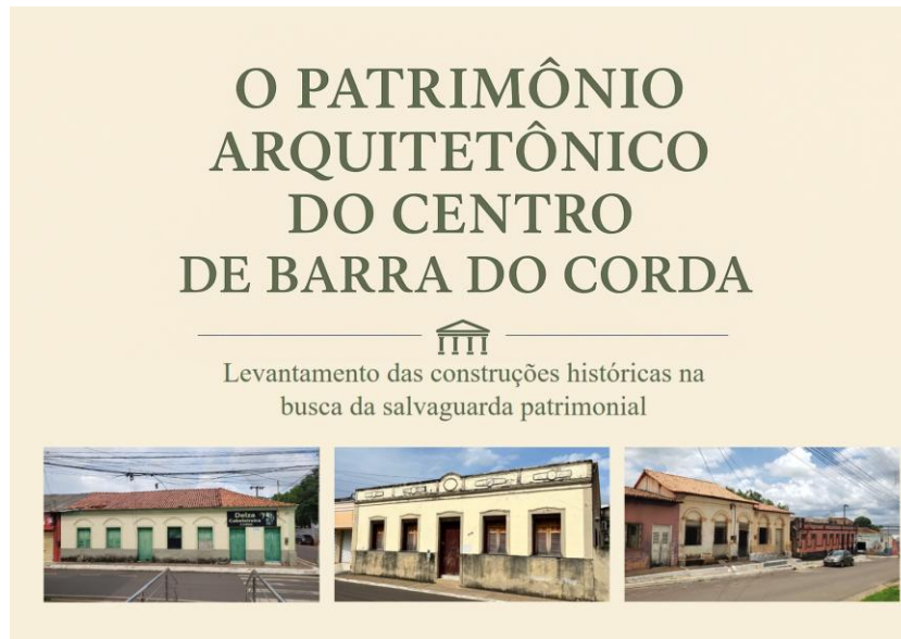
Imagem 03: Ilustração do dicionário arquitetônico.