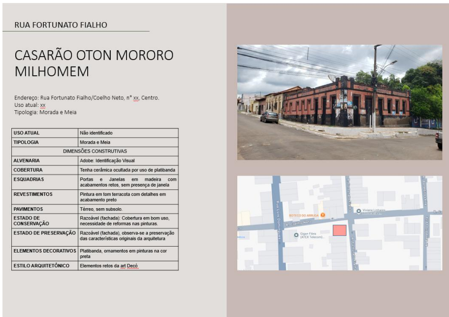
Imagem 04: Levantamento fotográfico com análise técnica da arquitetura e informações adicionais obtidas pela pesquisa teórica.