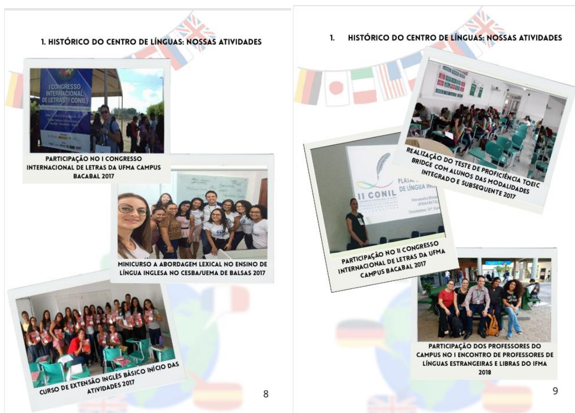
Figura 02: Histórico do Centro de Línguas do Campus Mangabeiras