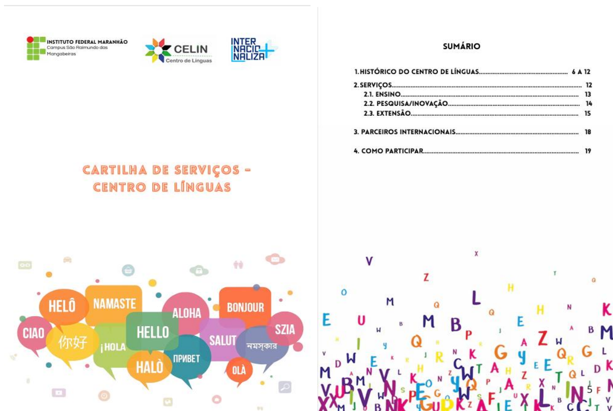
Figura 01 – Capa e Sumário da Cartilha