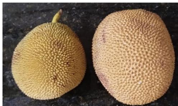
Figura 1 - Jaca adquiridas no mercado local.

As matérias-primas: jaca dura, cujo fruto possui bagos rígidos, as jacas “duras”, caracterizadas por sua polpa firme e densa, foram obtidas em mercado local, conforme Figura 1 a seguir.