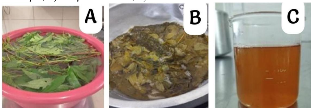
Figura 2 - Etapas de produção do extrato aquoso de vinagreira ( Hibiscus sabdariffa L. ): A) Sanitização; B) Cocção das folhas; C) Extrato obtido

Para extração do extrato aquoso, utilizou-se a proporção 1:3 (m/v), ou seja, 1 parte de folhas frescas para 3 partes de água. As folhas foram adicionadas à água aquecida a 100 °C, mantidas por 10 minutos e, em seguida, coadas com peneira de aço inoxidável. O líquido obtido foi denominado extrato aquoso de vinagreira e acondicionado em recipientes higienizados para posterior uso.