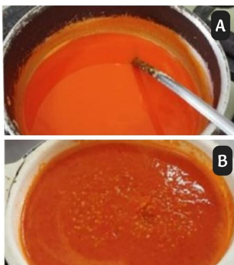
Figura 4 – Aquecimento do molho de pimenta (A) e Peneiração (B).

O produto foi peneirado, descartando-se resíduos sólidos (sementes e casca/epicarpo). O líquido obtido foi aquecido a 100 °C por 5 minutos, envasado em frascos plásticos higienizados com auxílio de funil estéril e armazenado à temperatura ambiente ( \approx 25 °C).