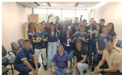
Figura 3 - Visita de alunos de escola municipal ao Museu Maker 3D.

entravam em contato com a equipe responsável pelo projeto para agendar as visitas dos alunos. Em seguida, eram selecionados os modelos impressos em 3D, com os quais os alunos teriam contato e interagiriam no ambiente. Ao final, eles expressavam suas opiniões sobre a experiência de aprendizado utilizando o material didático interativo.