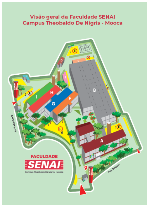
Figura 2. Mapa de localização do evento

. Funcionais – sinalização clara, facilitando a circulação e a organização do público;