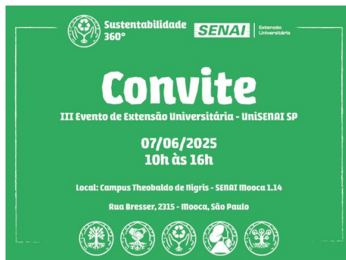
Figura 4. Convite para divulgação impressa e digital do evento

. Sociais – maior engajamento do público, que reconheceu o valor educativo e sustentável da proposta.