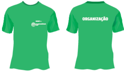
Figura1. Camiseta para organizadores

. Funcionais – sinalização clara, facilitando a circulação e a organização do público;