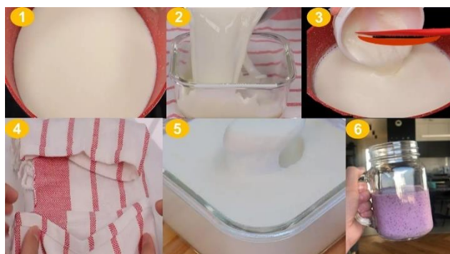
Figura 1: Etapas da produção de iogurte natural

A terceira etapa consistiu em realizar uma oficina prática de produção de iogurte natural, foi organizada em duas aulas: