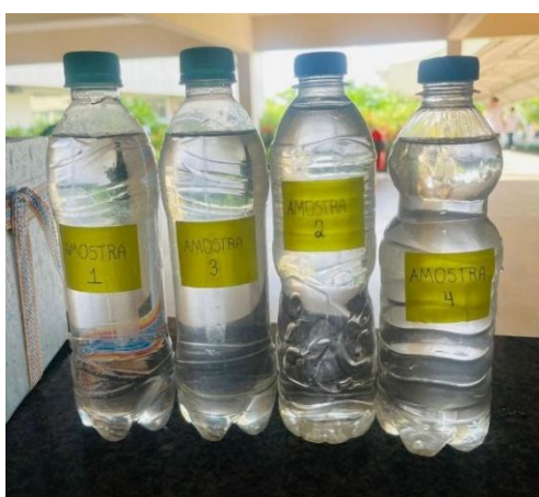
Figura 4: Amostras coletadas para análises.

No laboratório Biotec Ambiental determinou-se os parâmetros físico-químicos e microbiológicos a fim de observar a potabilidade e segurança da água distribuída no município de Presidente Dutra – MA.