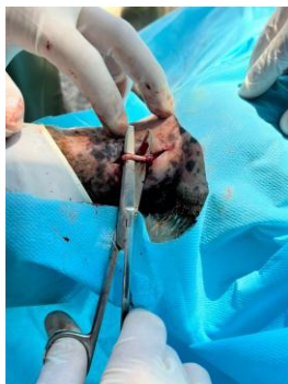
Figura 1 – Exposição do nervo digital palmar

No pós-operatório, foi administrada penicilina na dose de 22.000 UI/kg, por via intramuscular, SID, durante cinco dias, com a finalidade de prevenir possíveis infecções. Para o controle da dor e do processo inflamatório, utilizou-se flunixin meglumine na dose de 1,1 mg/kg, SID, por três dias. Após aproximadamente uma semana do procedimento cirúrgico, o animal encontrava-se em deambulação normal, sem sinais de claudicação.