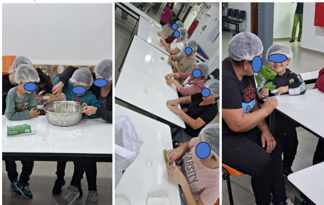
Figura 4 - Atividade com as famílias, preparação de bolacha com espinafre e cenoura