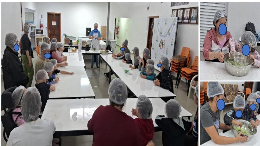
Figura 3 - Atividade com as famílias, preparação de bolacha com espinafre e cenoura