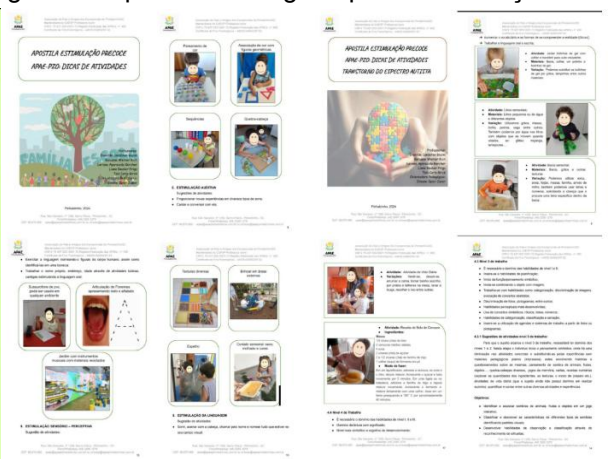
Figura 2 - Apostilas entregues para Estimulação