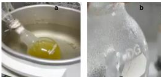
Figura 3 – Processo de desumidificação da oleína esterificada

ineficiência da etapa de desumidificação, uma vez que no decorrer da esterificação ocorre a formação de água como subproduto. Com o propósito de se reduzir o excesso de água na oleína esterificada, realizou o processo de desumidificação pela técnica de rota evaporação. Após a rotaevaporação ocorreu uma redução significativa de água contida na oleína (de 8,85% para 0,28% H 2 O). A Figura 3 ilustra as etapas de desumidificação da oleína esterificada pelo método de rotaevaporação.