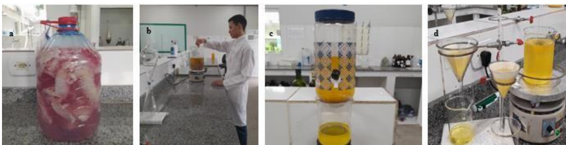
Figura 1 – Extração da oleína proveniente dos resíduos da carne de frango

Na etapa seguinte, a mistura foi submetida à decantação visando a eliminação da água residual da oleína. A Figura 1 mostra algumas etapas do processo de extração da oleína oriunda da carne de frango.