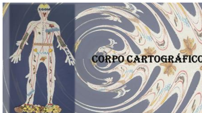
Figura 2 – Corpo Cartográfico

Ou na composição da outra, intitulada “Corpo Cartográfico”, que materializa em tecido, linha e elementos naturais, o corpo da pesquisa em diálogo com os registros recebidos.