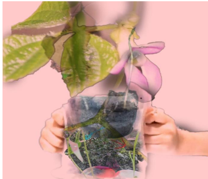
Figura 1 – O florescer é coletivo

convocavam. Um exemplo é a colagem digital intitulada “O florescer é coletivo”, elaborada pelo dinamismo criador (Perissé, 2009) de uma de nós a partir dos registros derivados das experiências com o Yoga.