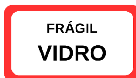
Figura 03 – Etiqueta identificadora de materiais compostos por vidro.

ARMAZENAMENTO DOS PRODUTOS: O estoque estava desorganizado, dificultando a separação; sugeriu-se padronizar o layout, com um único local para cada produto e etiquetas coloridas, que podem ser escritas à mão, facilitando a identificação.