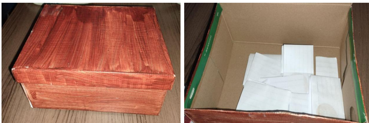
Figura 1 - caixa secreta para os relatos

Todos os relatos foram depositados em uma caixa, garantindo anonimato e liberdade de expressão. Após a conclusão, os relatos foram sorteados e discutidos em roda de conversa, de forma anônima, para que todas se sentissem confortáveis. Essa prática visou não apenas registrar experiências individuais, mas também criar um espaço seguro de escuta e compartilhamento, fortalecendo a confiança, a expressão e a coletividade entre as participantes.