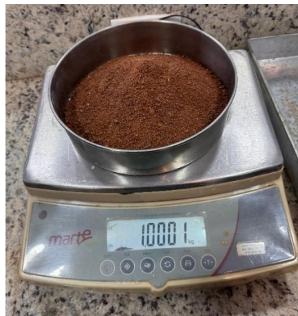
Figura 1 – Amostra de solo destorroada em almofariz com pistilo de madeira.

O ensaio de granulometria foi realizado conforme os procedimentos estabelecidos pela ABNT NBR 7181:2016. Inicialmente, uma amostra de 1 kg de solo foi submetida ao processo de destorroamento em almofariz com pistilo de madeira, a fim de desagregar os grumos presentes e aproximar as partículas de uma condição mais uniforme, como é possível ver na Figura 1.