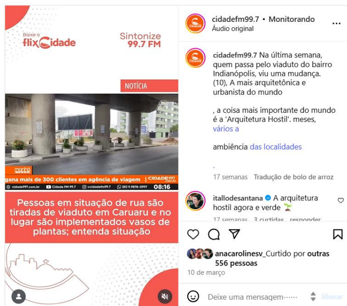
Figura 2. Página do post do Instagram da Rádio Cidade.

O armazenamento dos comentários em pasta digital e, principalmente, suas transcrições para um único documento facilitou a leitura flutuante, a identificação de padrões, a codificação e a categorização das mensagens. Consideramos todos os comentários acessíveis até o momento da coleta, com o devido cuidado para evitar duplicações e respostas replicadas. As mensagens foram sistematizadas de acordo com os códigos abaixo e com um sistema de legendas para identificá-los nos comentários (Quadro 1 e Figura 3). Ao final, o documento de registro das mensagens no Drive com as transcrições e as codificações teve 30 páginas