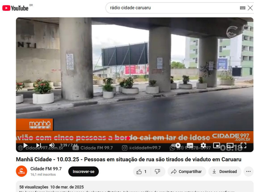
Figura 1. Página do YouTube .

Para isso, definimos como o lôcus da pesquisa o ambiente virtual, mais precisamente os comentários relacionados à matéria jornalística, produzida em 10 de março de 2025, intitulada de "Pessoas em situação de rua são tiradas de viaduto em Caruaru", pela Rádio Cidade no canal da emissora no YouTube e no perfil oficial dos veículos no Instagram (@cidadefm99.7), uma vez que, no site institucional, não constam comentários. O veículo de comunicação foi identificado como o único a repercutir a intervenção na cidade, o que justifica a sua escolha.