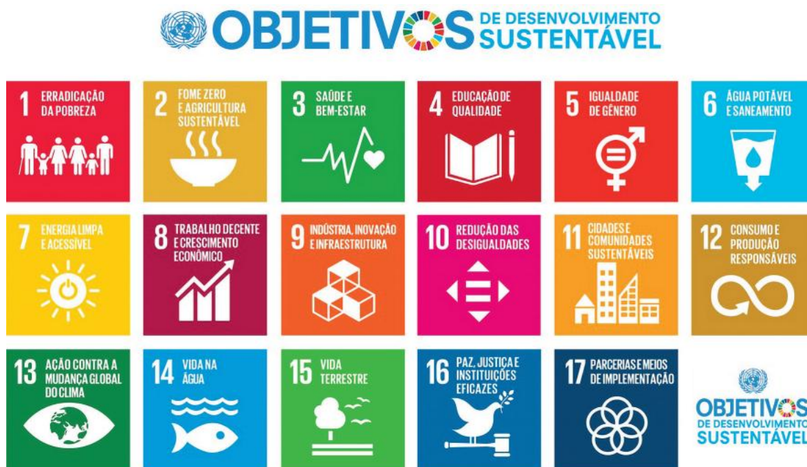
Figura 1. Os 17 Objetivos de Desenvolvimento Sustentável da Agenda 2030

A Agenda 2030 é composta por uma Declaração, 17 ODS (Figura 1) e 169 metas, uma seção sobre meios de implementação e uma renovada parceria mundial, além de um mecanismo para avaliação e acompanhamento.