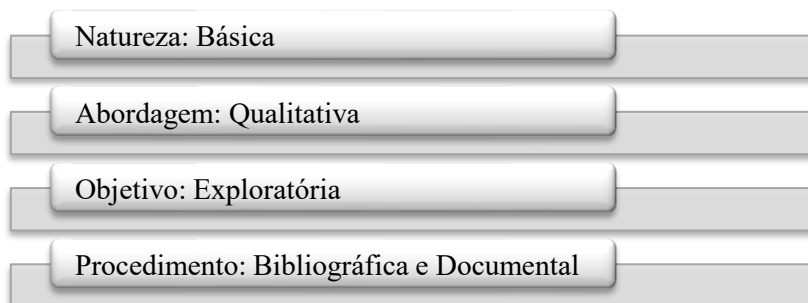
Figura 3. Metodologia da Pesquisa Científica

Observando a Figura 3, a metodologia da pesquisa utilizada quanto a natureza, trata-se de uma pesquisa básica ou pura, que diz respeito aos estudos que têm o intuito de produzir conhecimentos inéditos favoráveis ao progresso da ciência, contudo, sem a preocupação inicial com a aplicação prática. Em outras definições, a pesquisa básica se fundamenta no livre arbítrio do pesquisador pelo conhecimento, referindo-se a verdades e interesses universais. Por ser de cunho intelectual tem como objetivo a ampliação do conhecimento humano acerca de um assunto específico (GIL, 2008; TREVISOL NETO, 2017).