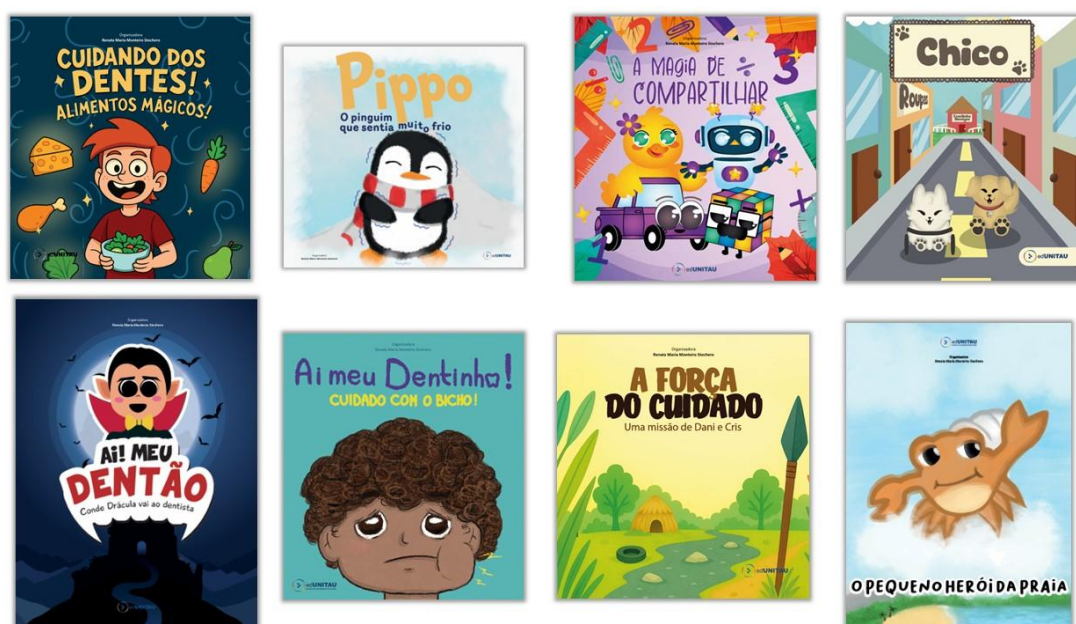
Figura 1 – Capas dos livros

Os resultados demonstraram que os alunos conseguiram integrar com êxito os conceitos das disciplinas envolvidas, produzindo livros infantis criativos e alinhados às temáticas dos ODS. O retorno das crianças e a validação do contador de histórias foram positivos, evidenciando o engajamento e a qualidade do material. A publicação dos livros pela EDUNITAU está em fase de finalização, com atribuição de ISBN, e o lançamento está previsto para novembro, acompanhado pela divulgação dos materiais produzidos pelos próprios alunos.